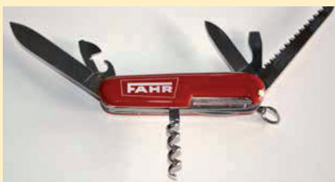
FAHR-Taschenmesser Euro 29,- /Stück zzgl. Versand