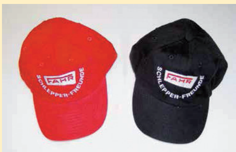
Hochwertige Baumwollmütze mit Metall-ver- schluss und eingesticktem FAHR-Schlepper- Freunde-Logo. Farbe: Schwarz oder Rot. Euro 10,-/Stück zzgl. Versand