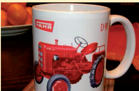
Motiv-Tassen, Euro 12,- in der Ausstellungshalle erhältlich