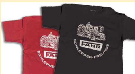
NEU ab ca. 26. April 2026: T-Shirt für Erwachsene rot/schwarz Euro 25,-/Stück zzgl. Versand