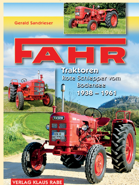
FAHR Traktoren - Rote Schlepper vom Bo- densee 1938-1961 A4, ca. 280 Seiten, € 30,-