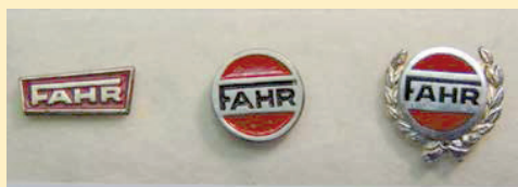
Nr. 1 € 5,- Nr. 2 € 10,- Nr. 3 € 15,-