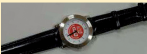
Armbanduhr Uhr mit Lederarmband Euro 40,-/Stück zzgl. Versand, solange Vorrat reicht.