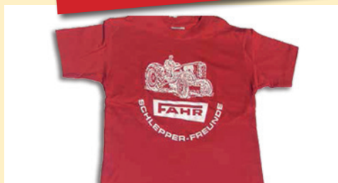
Kinder T-Shirts mit Aufdruck (vorne) Euro 19,-/Stück zzgl. Versand