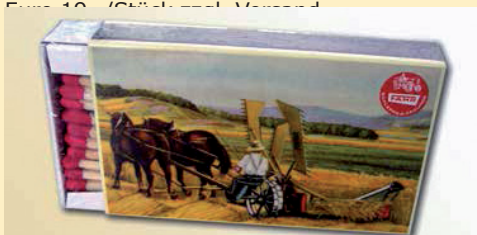
Kaminanzünder, Schachtel 120x65mm Euro 2,- /Stück zzgl. Versand