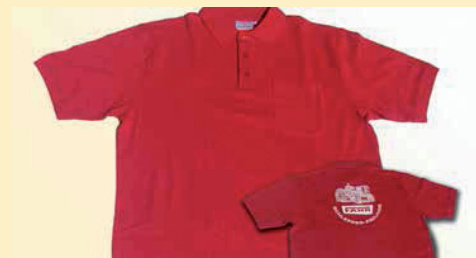
Polohemden rot, mit Brusttasche, mit Auf- druck (Rücken), (Bitte gewünschte Größe angeben, z.B. XXL) Euro 39,-/Stück zzgl. Versand