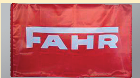
FAHR Hissflagge Grösse 60x90 cm mastseitig mit Gurtband und Karabiner- haken. Preis Euro 18,-