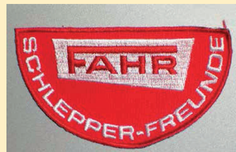
Aufnäher mit Vereinseblem Euro 9,-/Stück zzgl. Versand